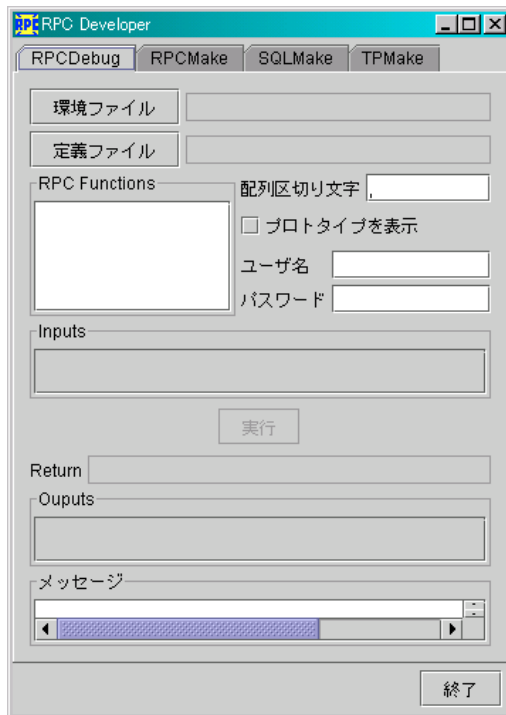
図 1.3: RPC Developer の GUI 画面

RPC Developer は、前述の全てのユーティリティを統合的に取り扱う GUI ツールです。 RPC Developer は、コマンド”rpcdev”を使用します。