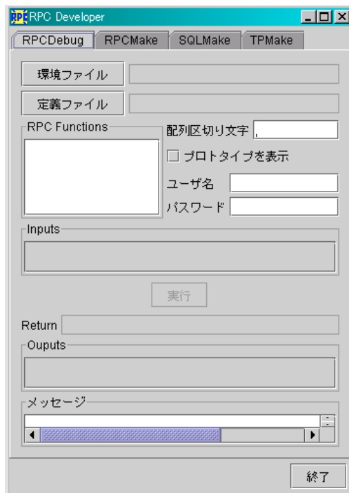
図 1.3: RPC Developer の GUI 画面

RPC Developer は、前述の全てのユーティリティを統合的に取り扱う GUI ツールです。 RPC Developer は、コマンド”rpcdev”を使用します。